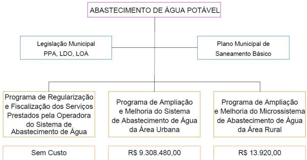
Figura 1: Fluxograma de programas para os serviços de abastecimento de água potável.

A partir da identificação do cenário futuro, do estabelecimento das metas e da priorização dos objetivos, prossegue-se abaixo com um fluxograma e a descrição detalhada de cada programa.