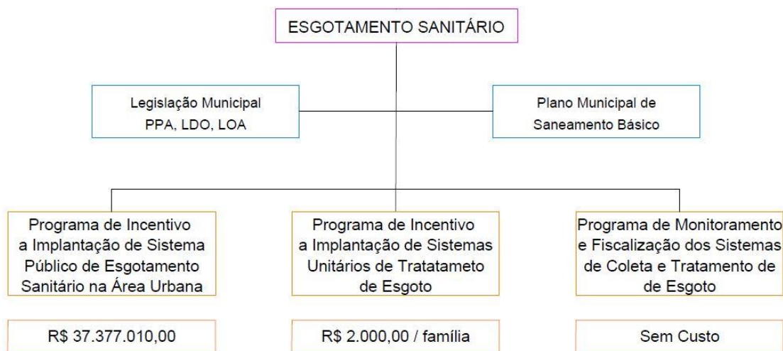
Figura 2: Fluxograma de programas para os serviços de esgotamento sanitário.

A Figura 2 apresenta o fluxograma com a estrutura dos Programas estabelecidos para os serviços de Esgotamento Sanitário, cujos detalhes são apresentados a seguir: