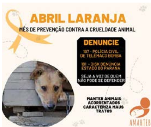
FOTO 7 - RINHA

Com essa atitude você poderá contribuir para mudar a realidade e a qualidade de vida de muitos animais que estão em situação de risco ou abandono por aí.