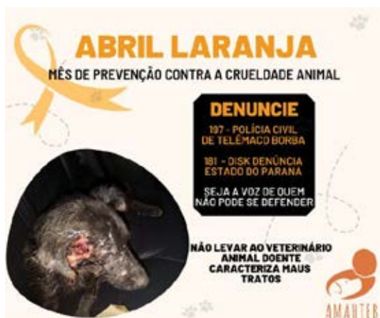
FOTO 6 - ACORRENTAR

Por isso, antes de adotar ou comprar um animal, é importante verificar se ele está de acordo com seu estilo de vida.