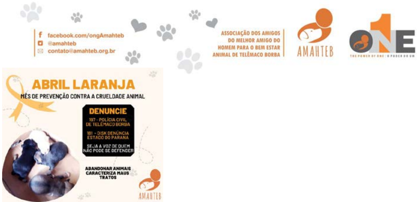
FOTO 4 - ABANDONO

Segundo a Organização Mundial da Saúde (OMS), o Brasil possui mais de 30 milhões de animais abandonados, incluindo aproximadamente 20 milhões de cães e 10 milhões de gatos. Nas grandes cidades, há um cachorro para cada cinco moradores, sendo 10% deles abandonados.