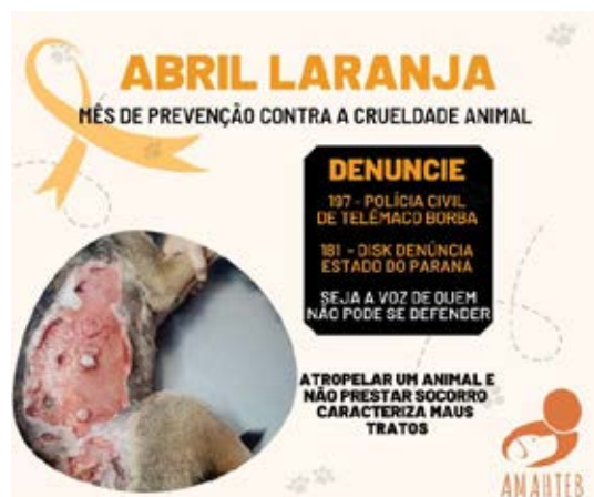
FOTO 3 - ABANDONO

O abandono de animais, em especial os animais domésticos, como cães e gatos, é um problema que afeta de maneira cada vez mais os centros urbanos.