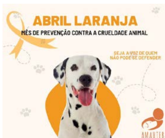
FOTO 2 - ATROPELAR

Com essa atitude você poderá contribuir para mudar a realidade e a qualidade de vida de muitos animais que estão em situação de risco ou abandono por aí.