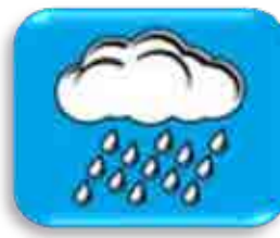
Drenagem e Manejo de Águas Pluviais