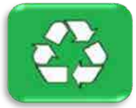
Manejo de Resíduos Sólidos