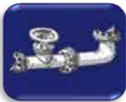
Abastecimento de Água Potável

Conjunto de medidas que visa preservar ou modificar as condições do meio ambiente, com a finalidade de promover a saúde, minimizar a poluição, melhorar a qualidade de vida da população e incentivar a atividade econômica, abrangendo os seguintes setores: